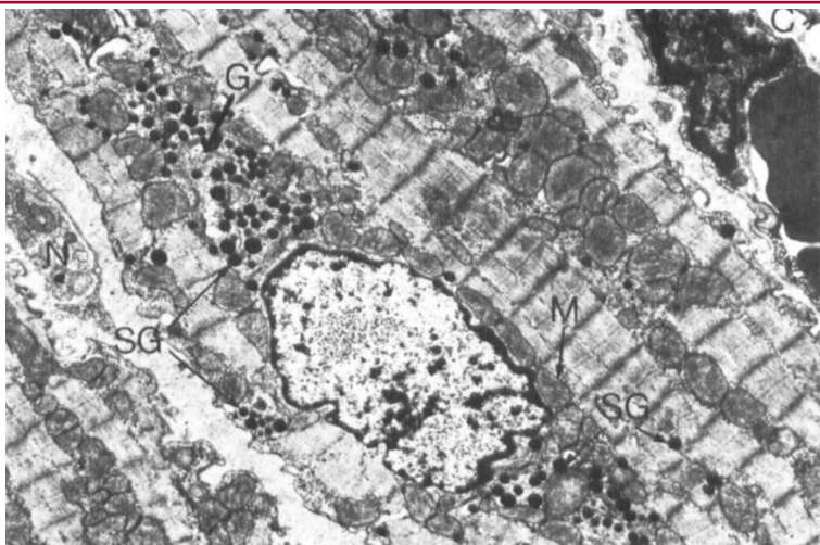
Fig. 1. Sección a través de una porción de la pared auricular de la rata. El núcleo sarcoplásmico central de un músculo auricular. La célula muestra numerosos gránulos específicos (SG), mitocondrias (M) y perfiles de complejo de Golgi (G). De: De Bold AJ, Bencosme SA. Studies on the relationship between the catecholamine distribution in the atrium and the specific granules present in atrial muscle cells. 1. Isolation of a purified specific granule subfraction. Cardiovasc Res. 1973 May;7(3):351-63. doi: 10.1093/cvr/7.3.351.